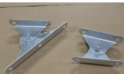
Кронштейн для крепления светильника к стене или к потолку