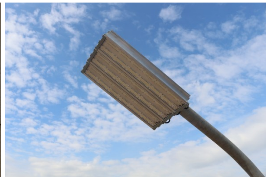
светильник на опоре освещения

Светильники также можно устанавливать при помощи тросового подвеса