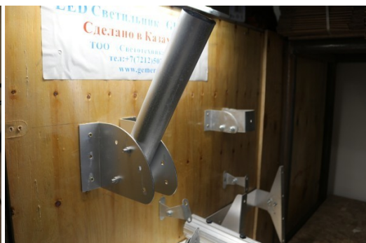
Настенный кронштейн с возможностью регулировать угол наклона