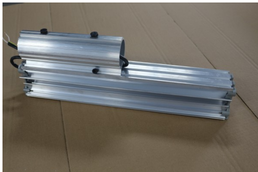
светильник в сборе